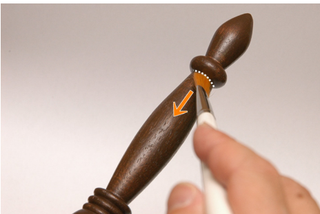
⑤握る部分の半分は上から下へ塗る。 (溝に塗料が溜まるのを防ぐため)