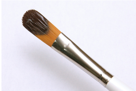
筆にはあまり塗料を付け過ぎない。 (写真ぐらいが良い)