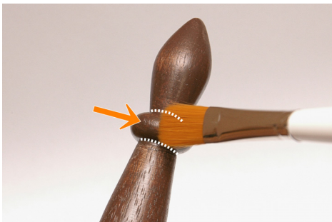
⑥盛り上がった部分は横に塗る。 溝に塗料が溜まってしまったら上下にのばす。