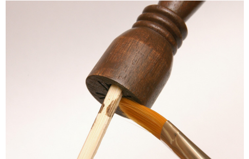
①写真の順番で塗って行く。