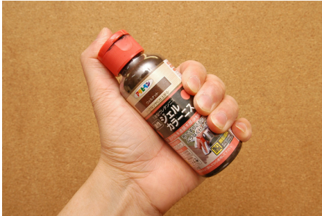
塗料は使用前によく振っておく。 (分離しているのでよく混ぜる)