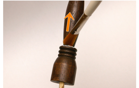
④握る部分の半分は下から上へ塗る。 (溝に塗料が溜まるのを防ぐため) ※⑤も参考